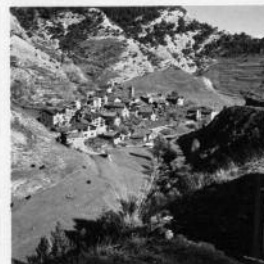
Pal (La Massana)