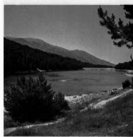
Estany d'Engolasters (Encamp)