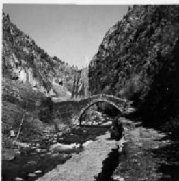
Pont de Sant Antoni