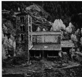
Saint Joan de Castell